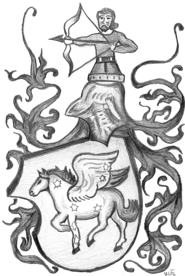
Erbovní znamení Mistra Martina Bacháčka z Nauměřic (kresba M.H.)