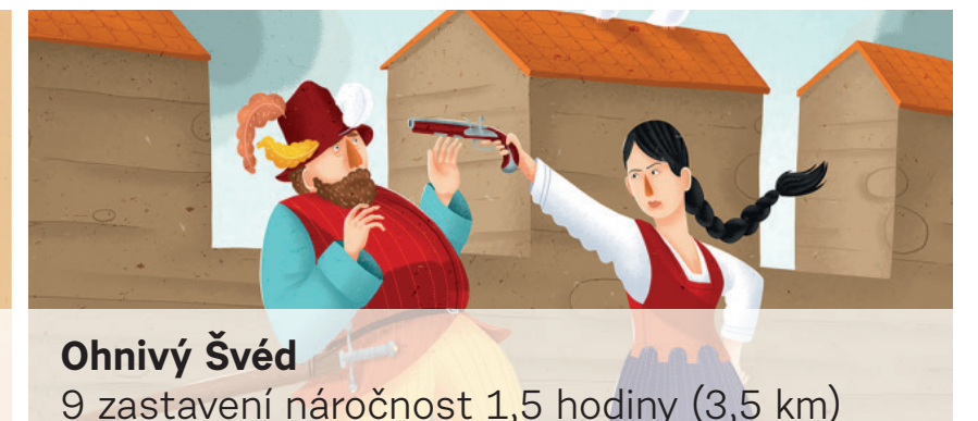
Ohnivý Švéd 9 zastavení náročnost 1,5 hodiny (3,5 km)