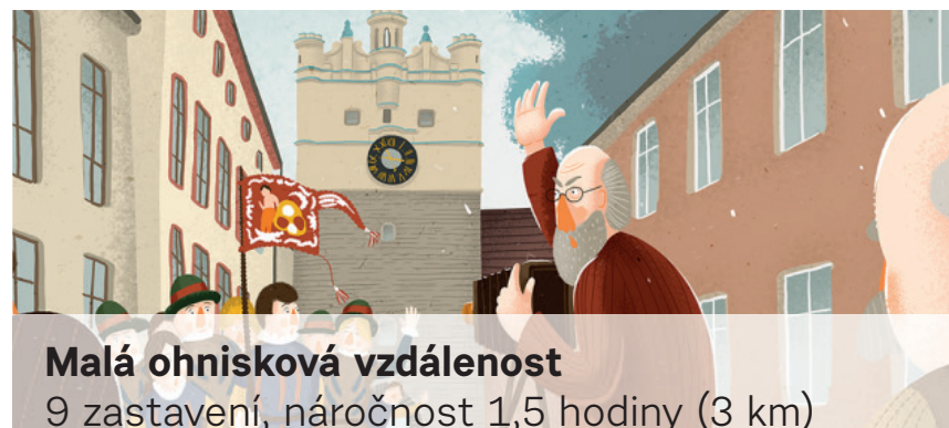
Malá ohnisková vzdálenost 9 zastavení, náročnost 1,5 hodiny (3 km)